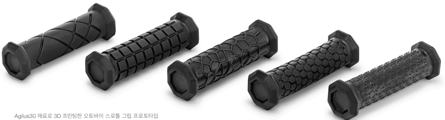
Agilus30 재료로 3D 프린팅한 오토바이 스톨 그립 프로토타입

J850 Pro를 사용하면 프로토타입을 더 빠르게 테스트 및 검증하고 담당자의 검토를 쉽게 진행할 수 있는 기능적인 복합 재료 모델을 손쉽게 제작할 수 있습니다. 이를 통해 더 신속하게 의사 결정을 내리고 승인을 얻을 수 있으므로 제품 검증을 수행하고, 생산량을 늘리며, 귀중한 시간을 절약할 수 있습니다.