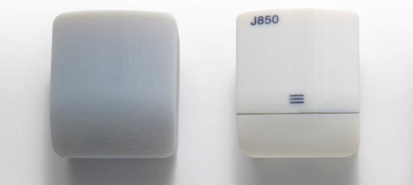
DraftGrey(왼쪽) 및 VeroPureWhite(오른쪽)로 3D 프린팅한 이어버드 케이스 프로토타입