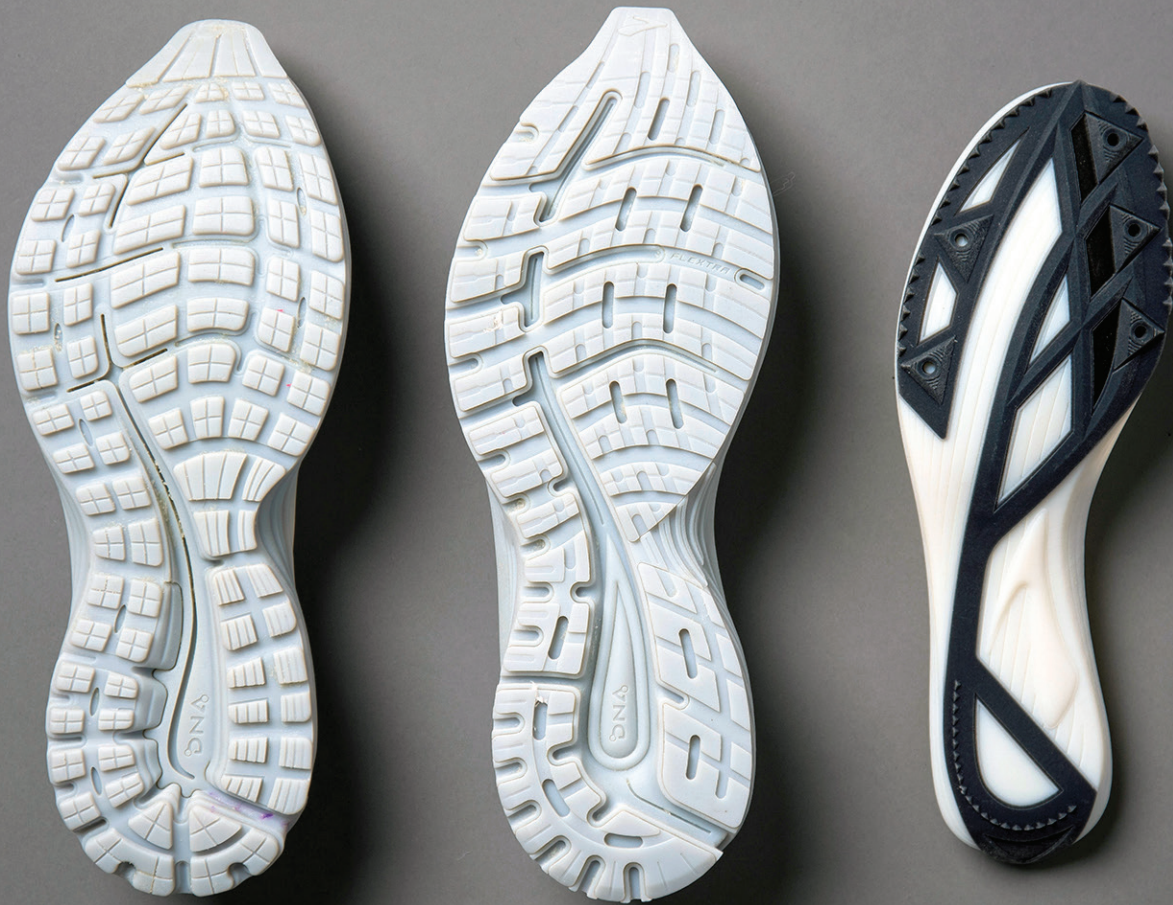
브룩스 러닝(Brooks Running)에서 제작한 3D 프린팅 신발 중창 및 밑창 프로토타입