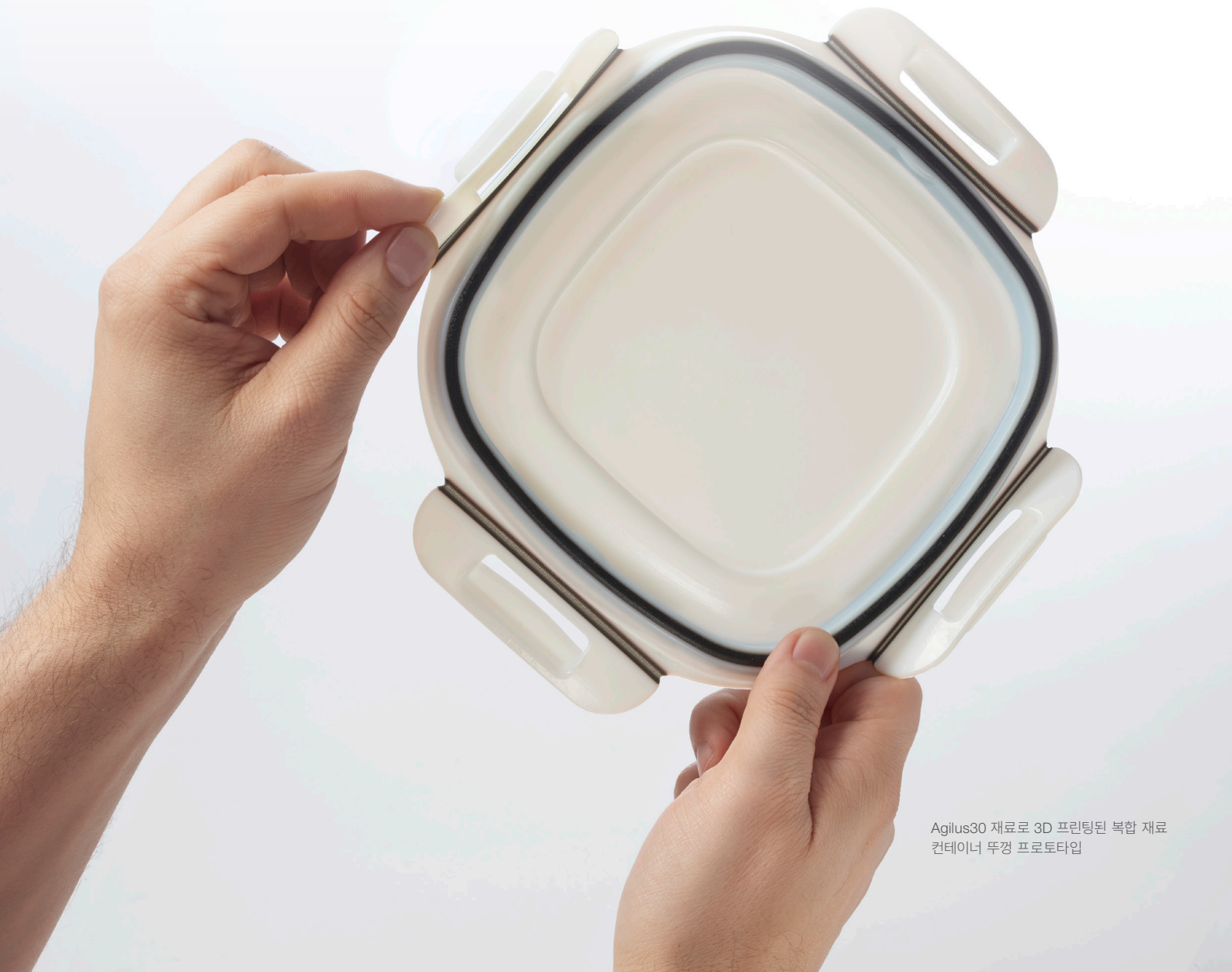
Agilus30 재료로 3D 프린팅된 복합 재료 컨테이너 뚜껑 프로토타입

또한 풀 컬러 기능이 필요하게 되면 J850 Pro로 업그레이드하여 이러한 요구 사항을 충족할 수 있습니다.