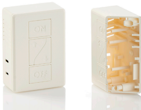
정교한 기능을 갖춘 이 프로토타입 스마트홀 스위치는 Stratasys F123 프린터에서 0.1778 mm 해상도로 구현되었습니다.

대부분의 3D 프린팅 플랫폼에는 프린터 작동, 파일 조작 및 문제 해결에 대해 해박한 지식이 있는 숙련된 전문가가 필요합니다. Stratasys F123 시리즈 프린터는 초기 설정에서부터 디자인 투 프린트 (design-to-print) 작업에 이르기까지 사용이 편리하도록 설계되었습니다.