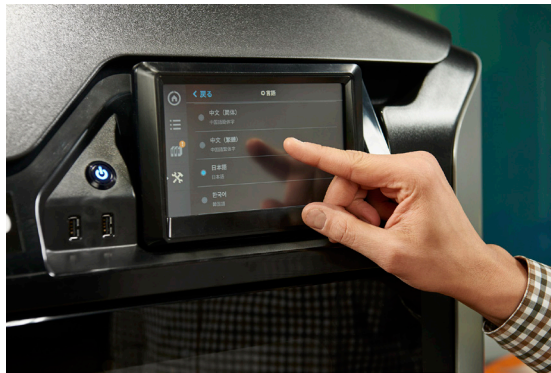
다중 언어 디스플레이를 지원하는 Stratasys F123 3D 프린터 터치스크린

Stratasys F123 3D 프린터는 작업 그룹의 생산성을 높이는 여러 기능을 제공합니다. GrabCAD Print 소프트웨어는 프린트 대기열 및 다중 트레이 관리를 지원하여 팀이 각 구성원의 프린트 작업을 확인하고, 프린트 순서를 관리하고, 작업 중요도를 정할 수 있도록 합니다. 이 소프트웨어는 또한 네이티브 CAD 파일을 가져오므로 CAD 모델에서 프린팅하기가 더 쉽고 빨라집니다.