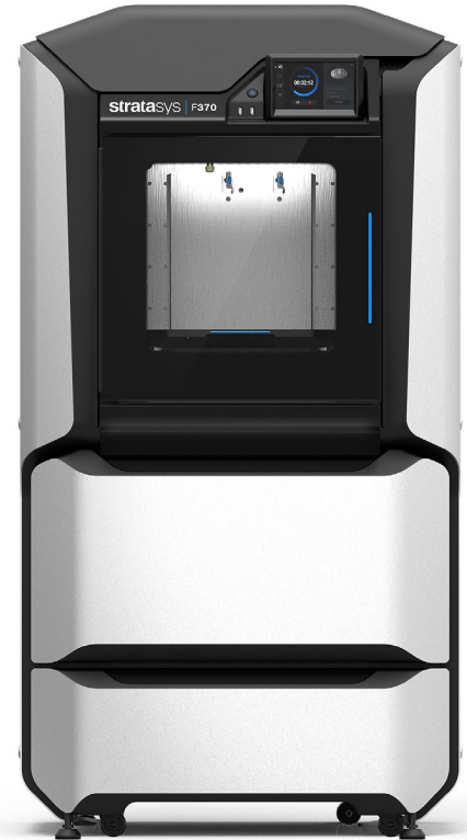
Stratasys F370™ 3D 프린터

기업이 경쟁력을 유지하기 위해 고객과 시장 수요의 변화에 빠르게 대응해야 하는 것은 당연한 일입니다. 유명한 대형 제조업체뿐만 아니라 소규모 디자인 회사의 경우에도 마찬가지입니다. 경쟁사보다 먼저 신제품을 출시하면 새로운 수익을 창출하고 시장 리더십을 유지하는 데 도움이 됩니다. 그러나, 특히 경쟁사와 동일한 수준에서 유사한 기술 및 프로세스를