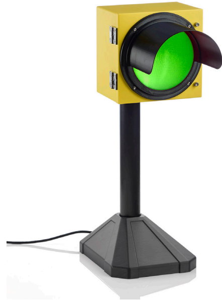
엔지니어는 UV 저항 ASA 소재를 통합하는 이 교통 신호에 대해 기능적으로 완전한 프로토타이핑을 구현했습니다.

초기 반복 작업에 최적이지 아닌 재료, 프린터 또는 서비스 센터를 사용하는 대신, Stratasys F123 프린터를 사용하면 디자인이나 고객 검토를 위한 여러 옵션을 신속하게 제작할 수 있습니다. 선택할 수 있는 다양한 재료에는 경제적인 PLA를 비롯하여 내구성이