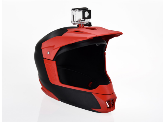
Stratasys F370 3D 프린터로 프로토타이핑 및 3D 프린팅된 모토크로스 헬멧과 부착되어 있는 빨간색 액세서리

STRATASYS가 더 빠르고 지능적이며 생산적인 신속 프로토타이핑을 구현할 수 있었던 이유