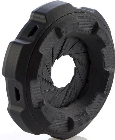
Stratasys F123 프린터의 수용성 서포트 기능을 통해 조절식 조리개가 탑재된 카메라 렌즈 커버를 프로토타이핑할 수 있었습니다.

STRATASYS가 더 빠르고 지능적이며 생산적인 신속 프로토타이핑을 구현할 수 있었던 이유