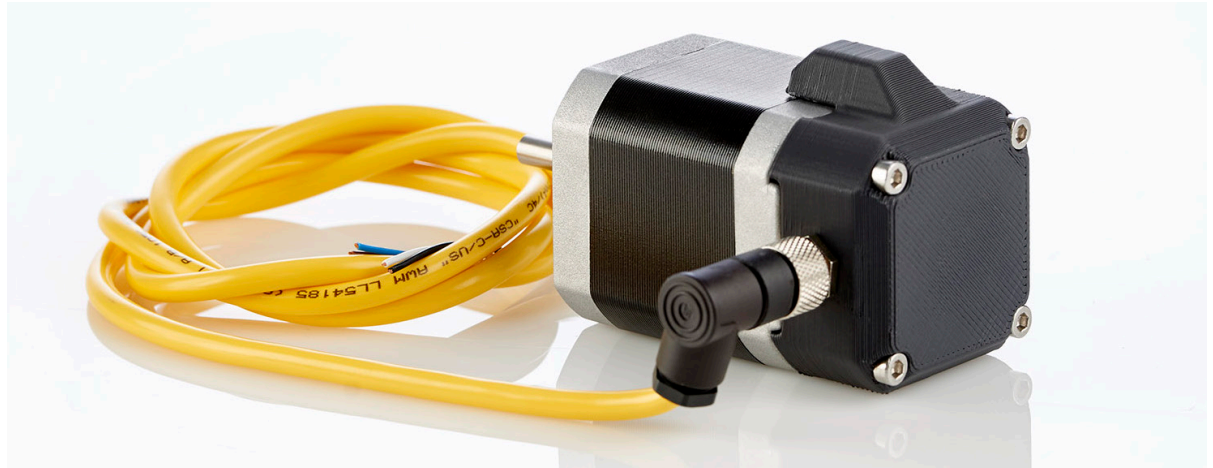
이 스테퍼 모터의 엔드 캡은 제대로 맞춰지는지 확인하기 위한 기능 테스트용으로 3D 프린팅된 것입니다.

STRATASYS가 더 빠르고 지능적이며 생산적인 신속 프로토타이핑을 구현할 수 있었던 이유