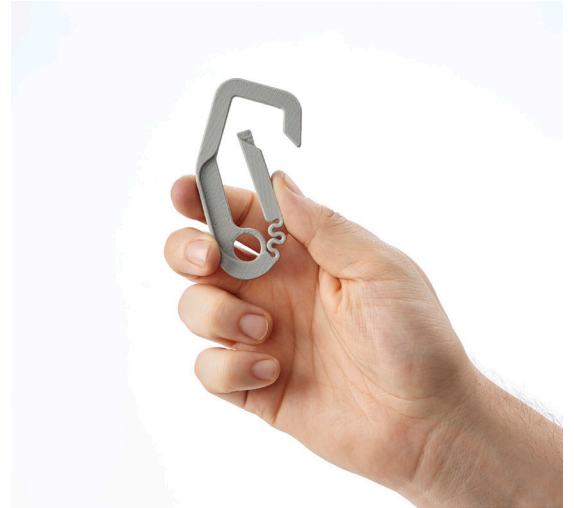
이 프로토타입 카라비너(carabiner) 디자인은 Stratasys F123 프린터 엔지니어링 플라스틱으로 제작되어 일상생활에서 유연성이 높은 경험으로 사용할 수 있습니다.

더 중요한 점은 이러한 3D 프린터가 사무실 환경을 위해 설계되었다는 것입니다. 이 프린터는 위험한 화학 물질이나 재료를 사용하지 않는 깨끗한 빌드 프로세스를 사용하며 표준 220볼트 사무실 전력으로 작동합니다. 3D 프린팅 모델은 자동 잠금식 도어가 있는 밀폐형 절연 빌드 챔버에 설치되어 안전하게 작동하며 외부의 물리적 간섭의 위험이 없습니다. 방음 기능이 있어 46dB 이하로 매우 조용하게 작동합니다. 이는 가정용 냉장고와 유사한 수준입니다.